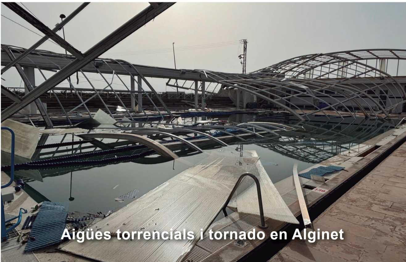
Aigües torrencials i tornado en Alginet