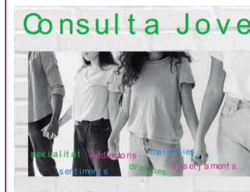
Al centre educatiu pots realitzar una consulta TOTALMENT