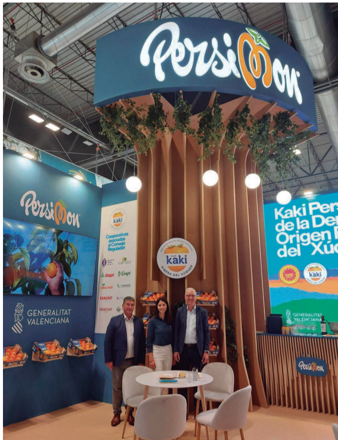
tres anys. Una marca que utilitza COAGRI que pertany a la DO Ribera del Xúquer i que aconsegueix ser molt potent dins del mercat nacional.

La marca comercial Persimon, l'únic caqui del món amb Denominació d'Origen Protegida arranca una nova campanya renovant la seua imatge de marca per a augmentar la seua presència internacional. A més, posarà en valor el seu producte mitjançant una ambiciosa campanya, que compta amb el suport d'un Programa de Promoció Europeu de 2,1 milions d'euros per als pròxims