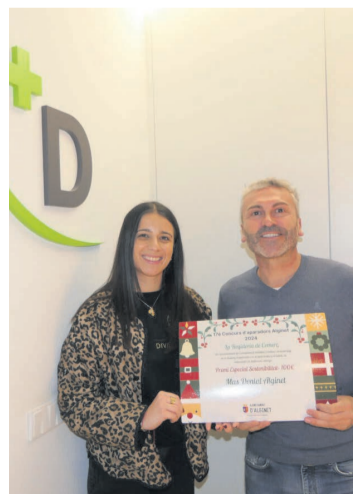
Sostenibilitat. Mas Dental Alginet