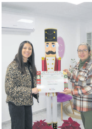
1r Estètica Cristina