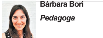
Bárbara Bori Pedagoga