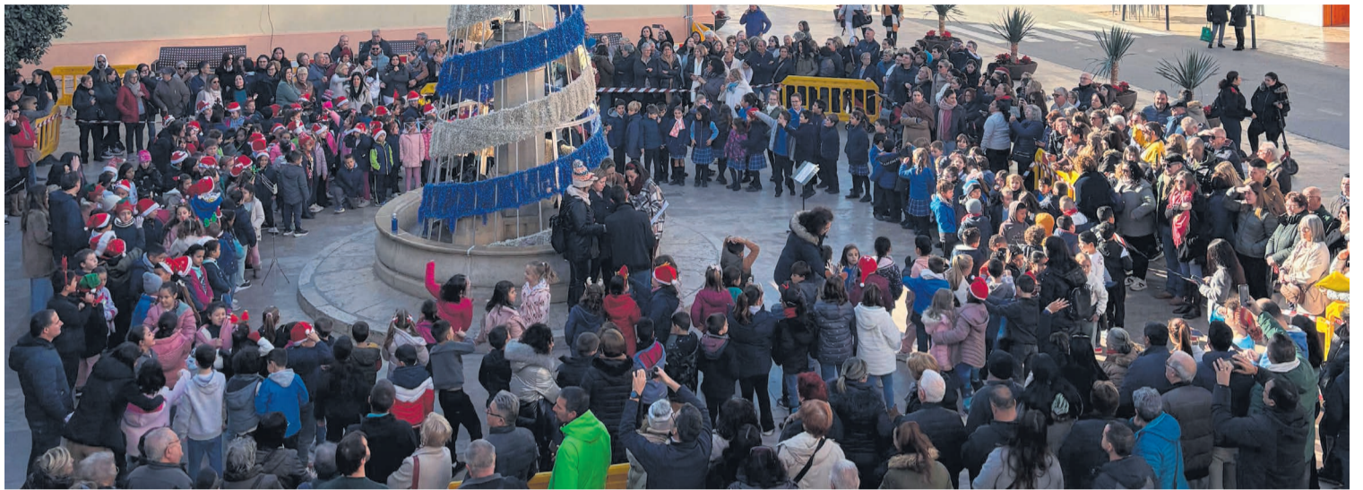
Els xiquets i les xiquetes canten les nades a la plaça de la Constitució

Tots a una veu cantaren nades típiques de l'època i en finalitzar van rebre un regalet de mans l'alcalde, el primer tinent alcalde, el tècnic de cultura i la lingüista de l'Ajuntament.