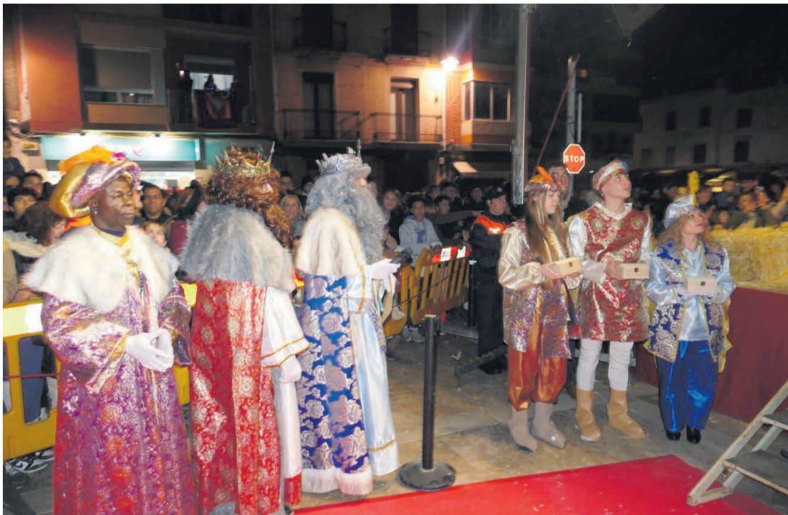
Els Reis Mags d'Orient a la plaça de la Constitució

Un any més, els Reis Mags han visitat el nostre poble