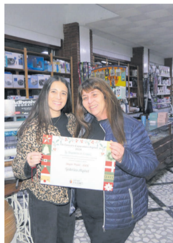
2n Galerias Alginet