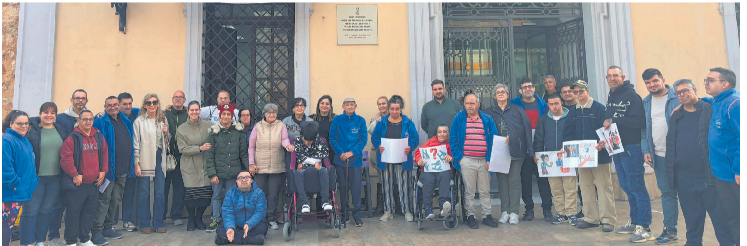
Usuaris del Centre de Dia, monitors i corporació municipal

Una forma de fer visible la seua situació i que la gent es pose en la pell d'una persona amb discapacitat.