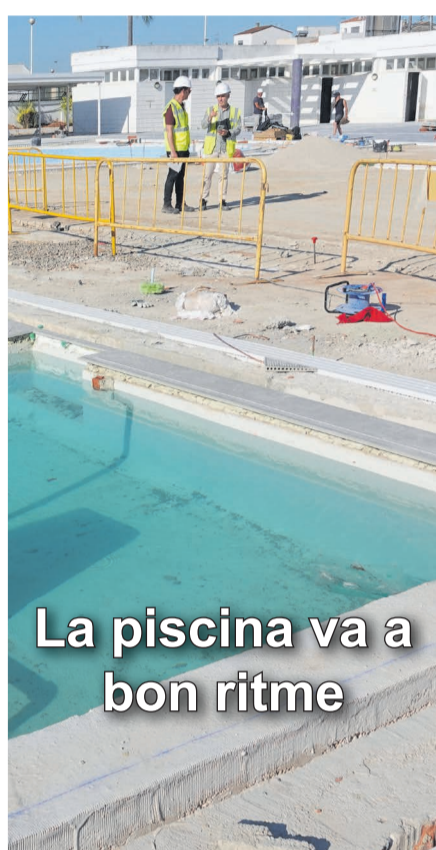
La piscina va a bon ritme