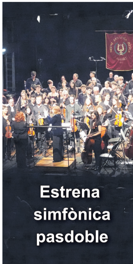
Estrena simfònica pasdoble