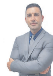
Rubén Pascual Cano Carlet Advocats

Si té qualsevol dubte o necessita ampliar aquesta informació, pot concertar una cita i vindre al nostre despatx, on l'assessorarem de manera personalitzada.